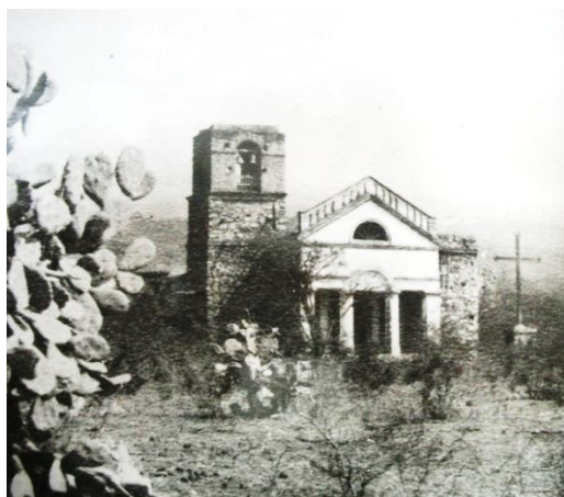
Figura 2: La capilla de Amadores aproximadamente a finales del siglo XIX. Sosa Gallardo (1969).