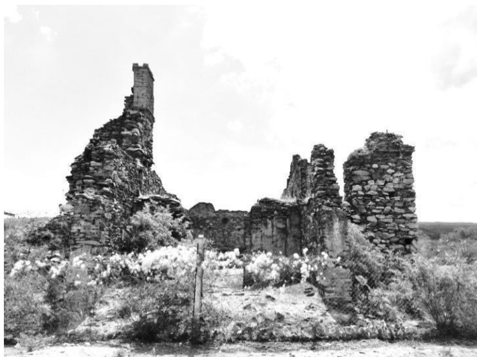
Figura 3: Estado de conservación de la capilla en el año 2014

cies externas regulares con ancho de muros de 0,60 m. Sobre los muros de roca se apoya uno de adobe, que es utilizado para dar los desniveles del techo; la altura de este muro varía según los desniveles que se dan. En relación a las rocas varían en tamaño (0,25 a 0,40 m) estando muchas de ellas canteadas. La argamasa que cohesiona a los mampuestos es de barro, sin otro tipo de aditamento, para las primeras etapas constructivas; a continuación se utilizó una argamasa abundante en cal y áridos, para unir los mampuestos cocidos. Los cimientos son de roca metamórfica local y tienen un ancho de 1 m con una profundidad aproximada de 0,80 m, los cuales apoyan sobre la roca natural sin mediar soluciones de continuidad que funcione como zanja de cimentación. El edificio consta de seis espacios que hemos denominado con números romanos (Tabla N°1).