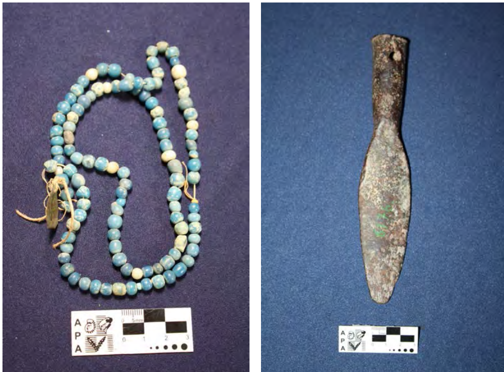
Figuras 2 y 3: Ejemplos de artefactos en vidrio y hierro (collar de cuentas de vidrio –MLP-Ar-(v)5856- y punta de lanza de hierro – MLP-Ar-(v)6176- ambas pertenecientes a la Colección Bruch).