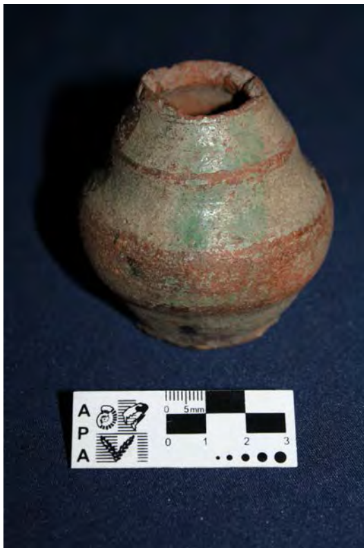
Figura 4: Ejemplo de manufactura con torno y vidriado de superficie (mate -MLP-Ar-(v)6076 – Colección Bruch).