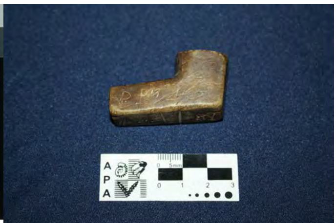
Figuras 7 y 8: Ejemplos de decoración: Peineta y tocado y escritura (Fragmento de figurina –MLP-Ar-(v)-1739 Colección Moreno- y pipa sin número de identificación)