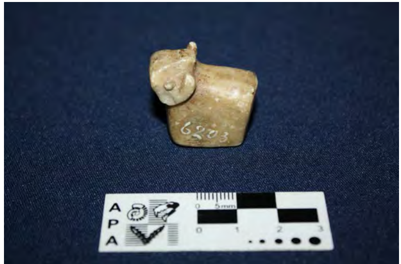
Figuras 5 y 6: Ejemplos de nuevas morfologías (campana de bronce –MLP-Ar-(v)1860- y amuleto tallado con forma de carnero –MLP-Ar-(v)1986- ambos pertenecientes a la Colección Moreno).