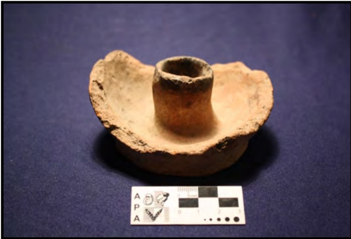
Figura 9: Ejemplo de nueva funcionalidad (Candelabro –pieza sin referencia de colección o procedencia-)