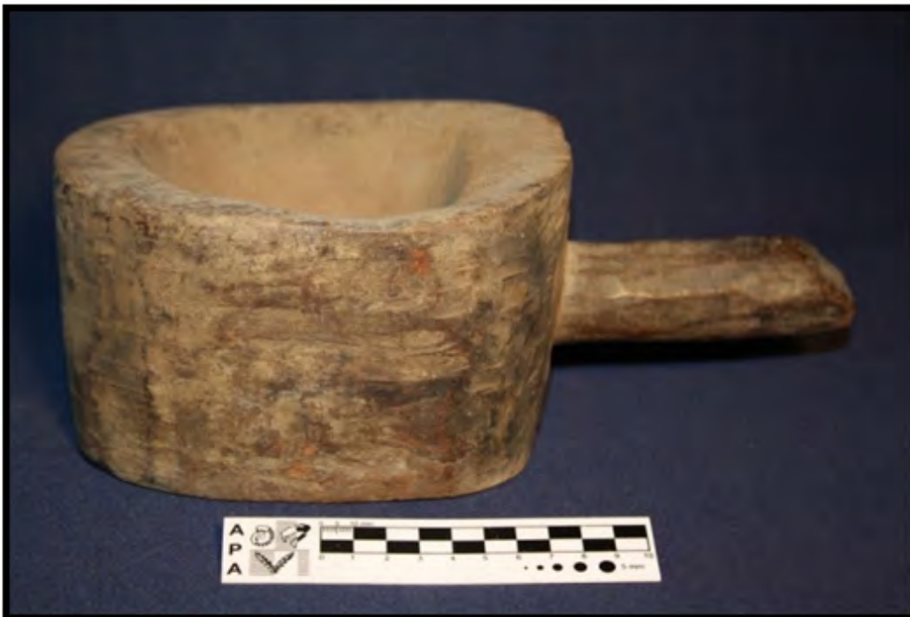
Figura 10: Ejemplo de pieza “sospechosas” (Posible mortero de madera –pieza que procede de la Patagonia, sin referencia de colección-).