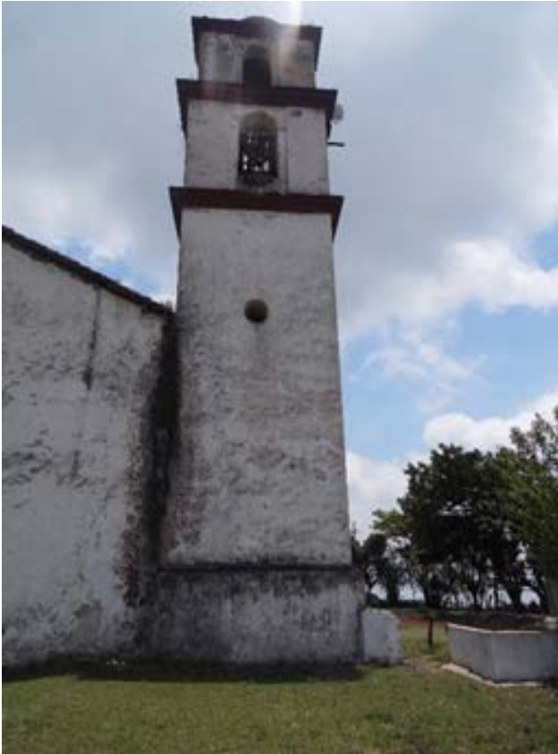
Figura 7. Torre-campanario.

Estos últimos elementos descritos que no aparecían en estos elementos pictográficos muestran un avance que debe ser estudiado e investigado por la arqueología histórica porque son reflejo de este pasado reciente, de lo que hicieron estas personas para satisfacer sus necesidades y que sirven para comprender nuestro presente.