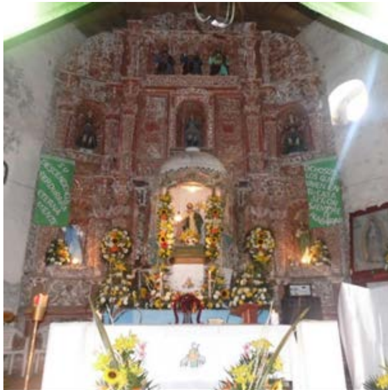
Figura 12. Retablo de la iglesia San José Paxtepec.

Al perder importancia el pueblo de San José Paxtepec ante la consolidación de dominio de nuevos espacios en la sierra de Chiconquiaco, entre ellos Chapultepec y Misantla, fue en pronunciado deterioro el edificio e incluso la sustitución de algunos elementos como el de la cruz atrial por otros de menor talla escultórica y deteriorándose los elementos que vistieron el edificio, entre ellos la puerta porciúncula, el portón de acceso, los retablos y el altar mayor (Figura 12), separado este, un metro del ábside.