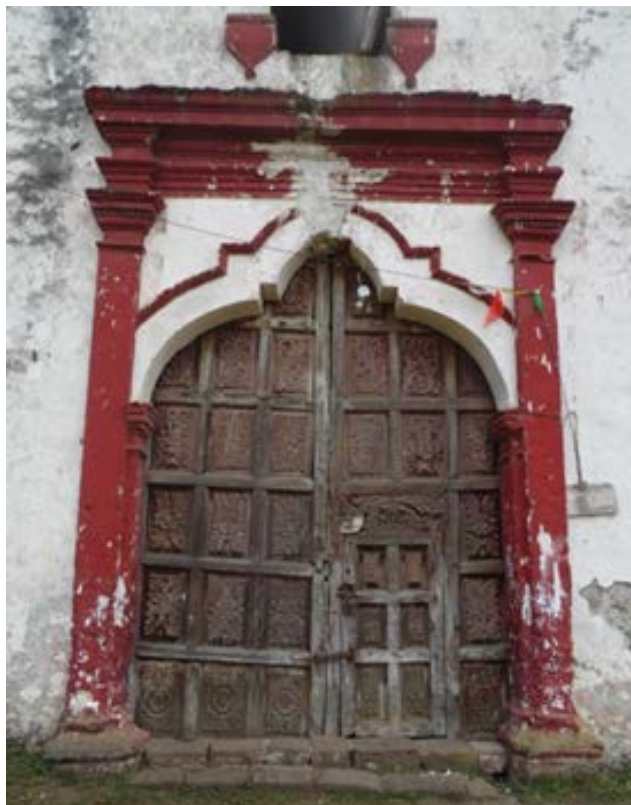
Figura 9. Puerta de acceso al templo.