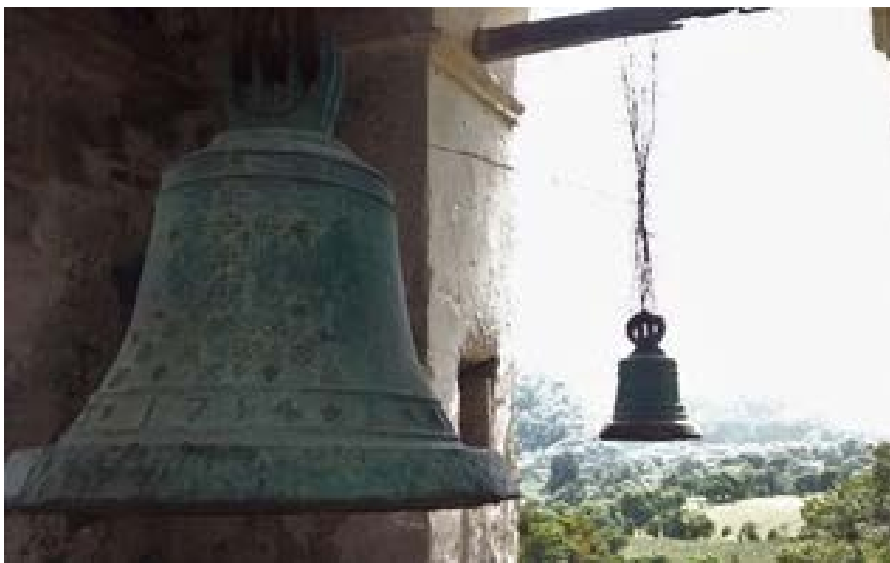
Figura 8. Campana con la inscripción “San Joseph ora pronnobis 1754”.