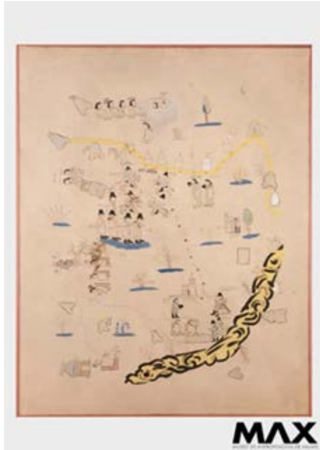
Figura 3. Códice Coacoatzintla.

Otro documento pictográfico que remite a Paxtepec es el Códice Coacoatzintla (Figura 3), en el que se representa al poblado con la forma indígena del glifo toponímico de un cerro, y al centro, dentro del mismo se encuentra un árbol, refiriéndose al árbol del pastle. A un lado, en la parte externa tiene la palabra “pah de pec que”.