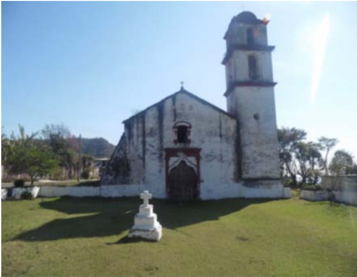
Figura 4. Iglesia San José Paxtepec.

El dibujo de la planta arquitectónica del recinto (Figura 5) también fue parte de los resultados de la propuesta de restauración, era importante dejar huella de los trabajos y de lo que se realizaba en el área. El documento representa una nave cuyas medidas son 10.55 m de ancho y 39.9 m de largo, convirtiéndola en una de las plantas más grandes entre los edificios religiosos del Estado de Veracruz. Esta era la forma arquitectónica dominante de este periodo y fue prácticamente exclusiva de México (Kubler, 1948). Este templo está circundado por una barda atrial con dos accesos principales, uno al poniente, otro al norte y uno más comunicaba al oriente con la huerta. La cruz atrial, elemento central en las construcciones religiosas, está presente en el conjunto de San José Paxtepec, presenta únicamente una pequeña oquedad en la parte superior del tercer basamento, cuya explicación es, de acuerdo a Navarrete (1979), que la cruz atrial original, de mayor tamaño, fue sustituida en algún momento por ésta.