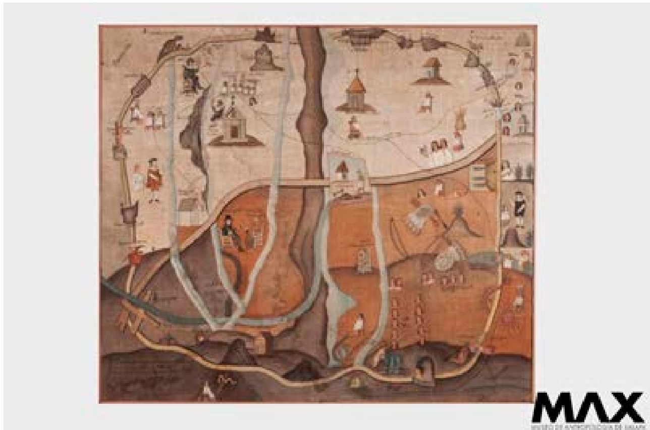
Figura 2. Códice Chapultepec.