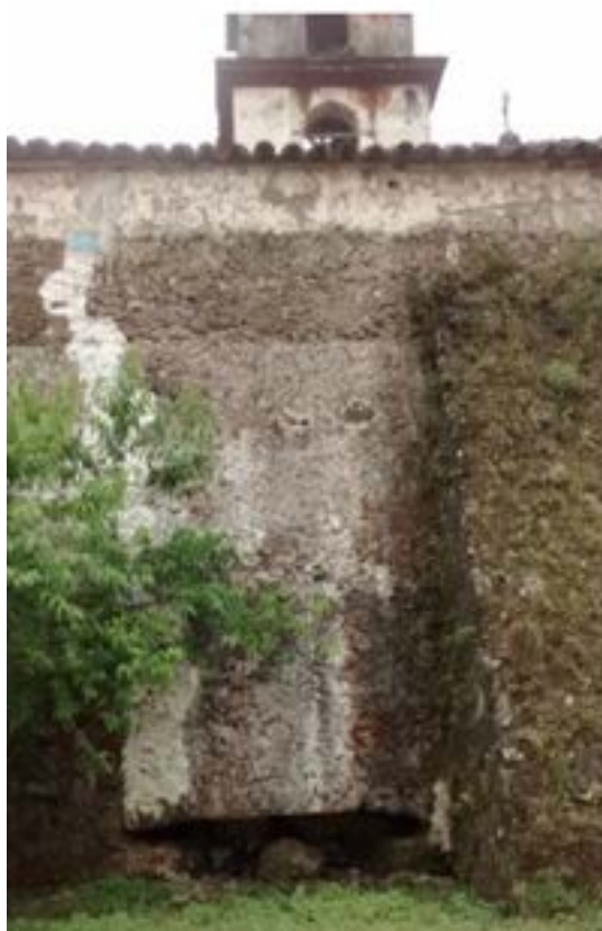
Figura 6. Puerta porciúncula.

Al tomar en cuenta lo comentado en el párrafo previo, se muestra la necesidad de quienes habitaban y utilizaban la iglesia, cómo la misma se adaptó a sus necesidades, considerándolo como un recinto de una planta bastante grande que debió albergar a muchos indígenas que tenían que convertirse a la nueva fe. En los códices, la representación de la iglesia era aún más sencilla de lo que es en realidad, no presenta una estructura extra, así que la sacristía que en algún momento posterior fue construida y ahora ya no existe, así como la torre adosada (Figura 7) debieron de edificarse alrededor de las fechas entre 1686, año mencionado por Villaseñor y Sánchez en su obra Theatro Americano (1750), como la fundación de Paxtepec, sin embargo fecha bastante difícil de ajustar por lo que muestran los códices mencionados; y 1754 que está inscrito en latín sobre una de las campanas (Figura 8) en la misma estructura y que podría referirse al emplazamiento de la campana. Entonces la fecha mencionada de 1686 (Villaseñor Y Sánchez, 1750), puede ser el comienzo del erguimiento de la torre. Por lo tanto el espacio que hay entre la fecha encontrada en la obra de 1750 y la inscrita en la campana dan un resultado de 68 años en los cuales se pudo dar la edificación de la estructura, alrededor de dos siglos después de la fundación de la iglesia.