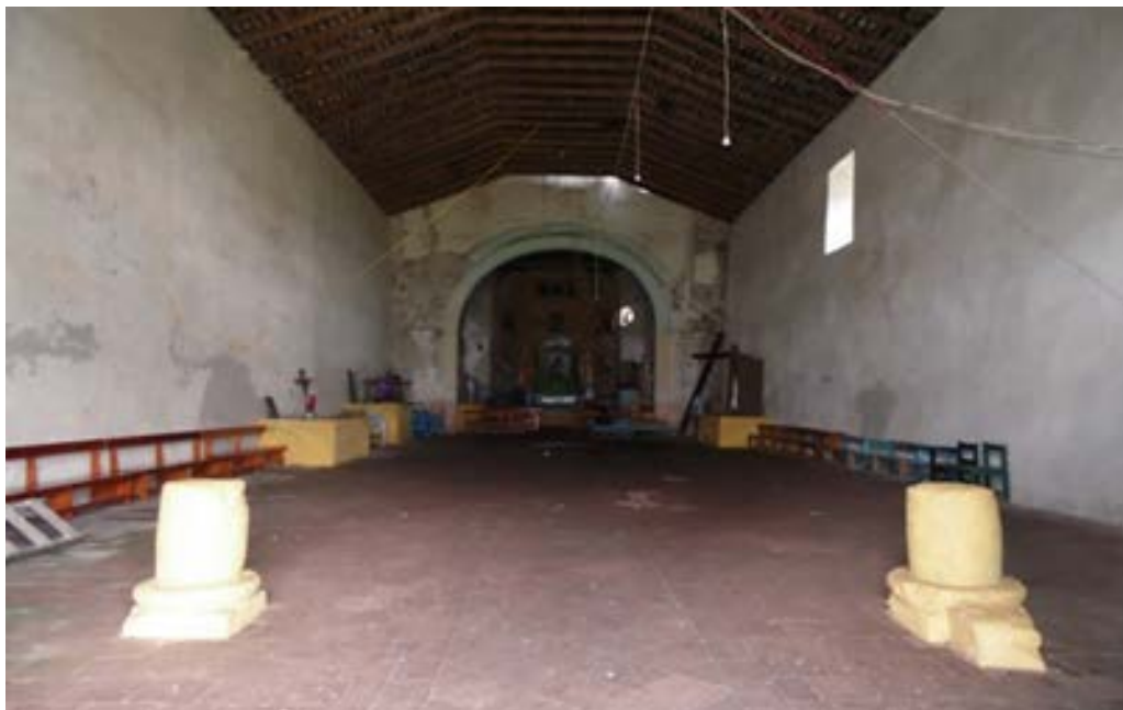
Figura 11. Arranques de las columnas que sostenían el sotocoro del templo.