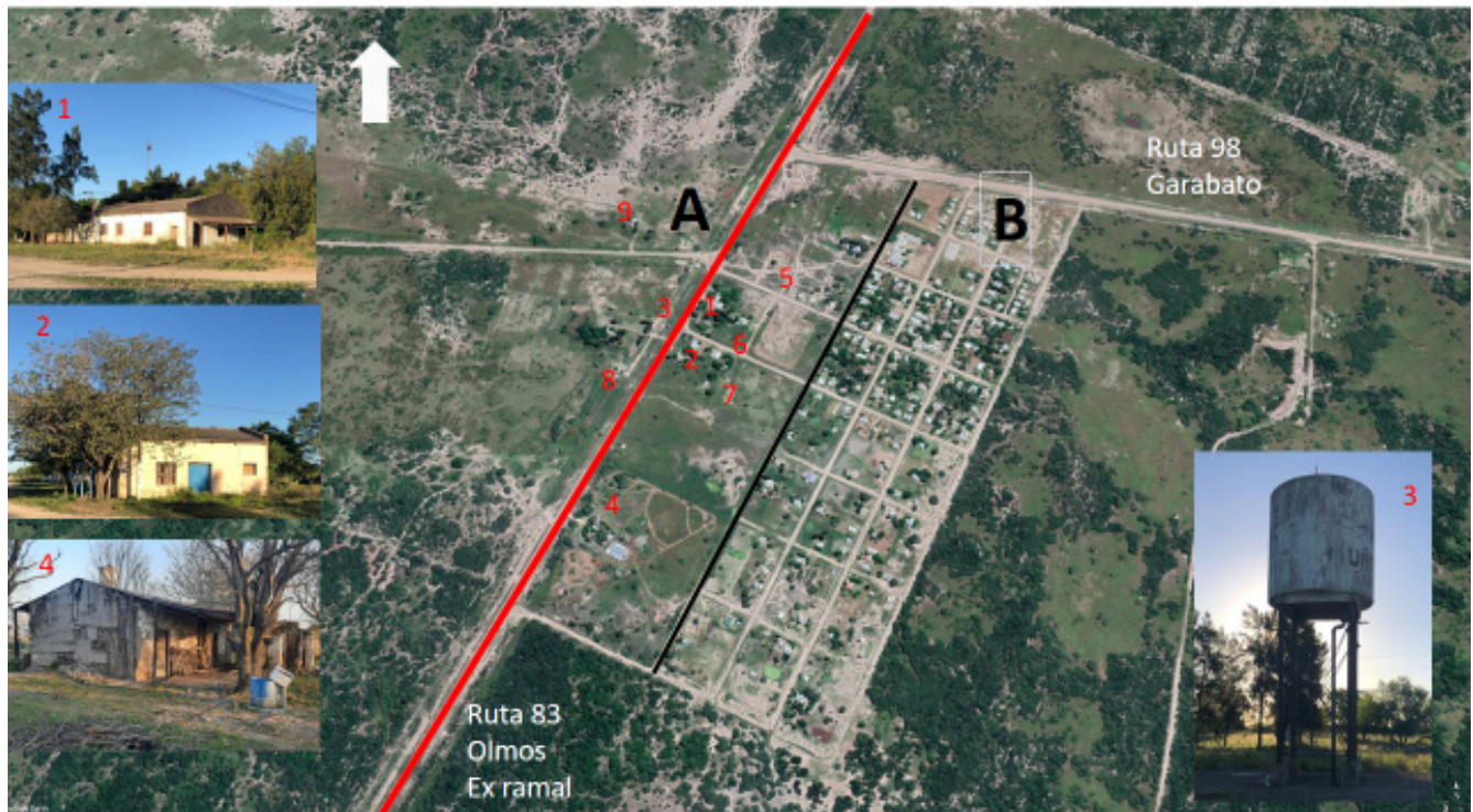
Figura 6. Sector A: almacén (1), carnicería (2), tanque de agua (3), matadero (4), cementerio (5), escuela (6), comisaría (7), vivienda contratista (8) y sector casillas de obrajeros (9). Sector B: nuevo trazado urbano posterior al cierre del ramal. Elaboración propia. Google Earth Pro.