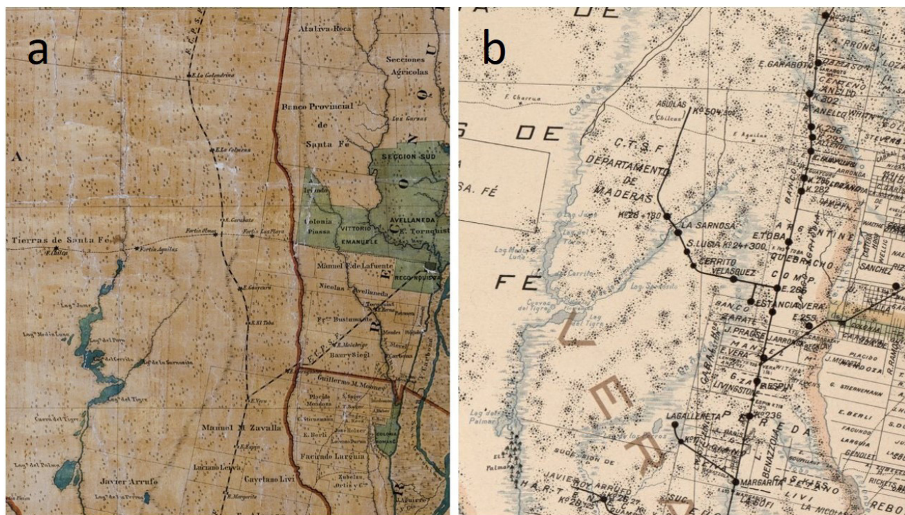
Figura 2. a: Nueva red ferroviaria del F.C.S.F. y estaciones al norte de Vera. Fuente: Plano Topográfico Catastral de la Provincia de Santa Fe, Ludwig, 1895; b: Nuevos ramales particulares: Santa Fe Land Company (E265, actual Ogilvie-dirección Olmos) y Compañía Tanino de Santa Fe (Margarita-La Gallareta). Fuente: Atlas del Plano Catastral de la República Argentina, Chapeaurouge, 1905. Fuente: Library of Congress.

Tras el agotamiento de los bosques de quebracho aledaños a la red del F.C.S.F., las compañías diseñan nuevas estrategias. En este sentido, la compañía Santa Fe Land Co. construye, entre 1905 y 1910, un ramal particular en el Kilómetro 13 sobre la red pública del F.C.S.F. (actual localidad de Ogilvie) para ingresar a los bosques de su propiedad. Sobre dicho ramal establece el Departamento de Maderas conocido como Estancia Vera, actual paraje Santa Felicia (Pasquali y Milicic, 2021) y pequeñas poblaciones dedicadas a la actividad forestal: Velásquez, Cerrito, Santa Lucía, La Sarnosa y Olmos al norte del Fortín Guaycurú (Chapeaurouge, 1905; Menchaca, 1913). Más al sur, Santa Fe Land Co. junto con la nueva Compañía Tanino de Santa Fe construyen un nuevo ramal, entre 1903 y 1905, al oeste de Margarita sobre el F.C.S.F. que conectaba dicha estación con la nueva fábrica de extracto de quebracho y pueblo La Gallareta (Argentine Railways, 1909; Menchaca, 1913). En sus inicios, la fábrica se abastecía de los bosques cercanos y los rollizos eran trasladados en carros tirados por bueyes. Agotados los bosques, la compañía prolonga un nuevo ramal en dirección noroeste, estableciendo el Km. 35 y el Km. 51 entre los años 1914 y 1930 (Mapa de los Ferrocarriles en Explotación, 1924; Comunicación personal con J. Waddell y M. Angueira) (Figura 2b)