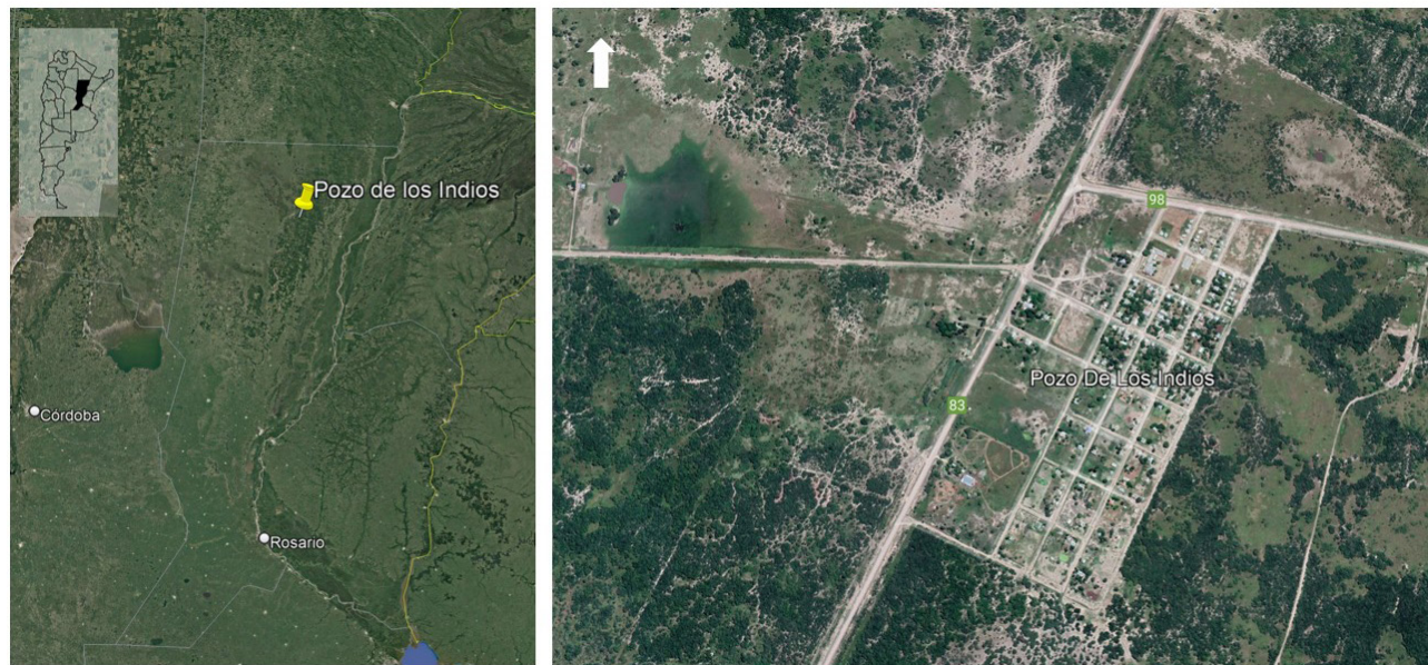
Figura 1. Ubicación geográfica de Pozo de los Indios, provincia de Santa Fe, República Argentina. Elaboración propia en base a Google Earth Pro, 2022.

y L. Ferré, 2019). La explotación inicial del quebracho en la provincia se limitaba a los alrededores de los puertos ubicados sobre la costa del río Paraná, fundamentalmente Reconquista. El posterior tendido ferroviario del F.C.S.F. posibilitó la explotación de los bosques de quebracho fuera de la costa, como así también, la instalación de obrajes y aserraderos sobre las estaciones de la nueva línea. La demanda de la madera, los avances en los estudios sobre sus aplicaciones industriales y las nuevas patentes junto con la modificación de los derechos aduaneros sobre el quebracho en Alemania, motivaron a capitalistas alemanes y a sus socios locales para establecer, en la zona nativa de Schinopsis balansae en la provincia de Santa Fe, fábricas para la producción de extracto de quebracho. Entre 1898 y 1912, se diseñaron y construyeron fábricas y pueblos en sus contornos para los trabajadores: Villa Guillermina propiedad de la Compañía Forestal del Chaco, La Gallareta de la Compañía Tanino de Santa Fe, Tartagal de la Argentine Quebracho Company y Villa Ana de The Forestal Land, Timber and Railways Company. Otras fábricas con menor capacidad de producción y desarrollo urbano fueron las de Mocoví, Santa Felicia, La Zulema y Fives Lille (Pasquali, 2020). 1